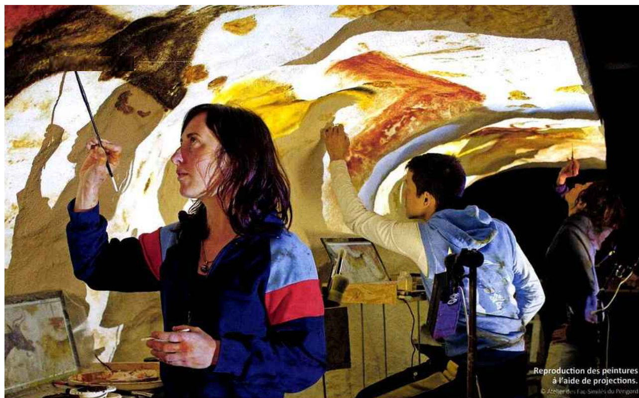
Reproduction des peintures à l'aide de projections. © Atelier des Fac-Similés du Périgord